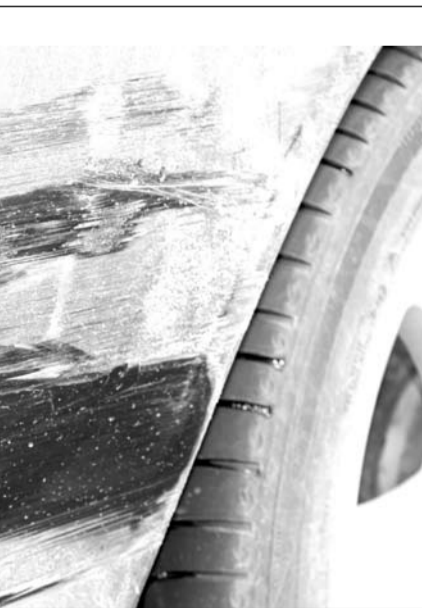
Царапины на машине потерпевшего

- Большинство правонарушений случается утром, - говорит инспектор дорожной полиции. - Люди торопятся на работу и не следят за Правилами дорожного движения. В последнее время участились нарушения, связанные с парковкой машин в неполюженном месте. Зачастую виновниками аварий ста-