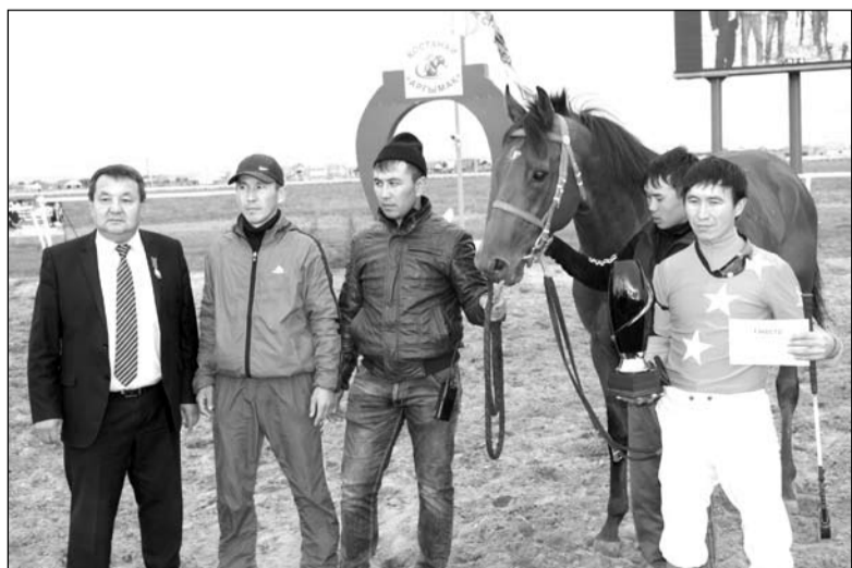
Жеребец Бастау пришел первым в скачках на приз города Астаны

Жокеи, участвующие в гладких скачках, как правило, небольшого роста и веса. На скачках жокей высоко сидит на стремянах с небольшой подачей вперед. Так правильно располагается нагрузка на лошадь.