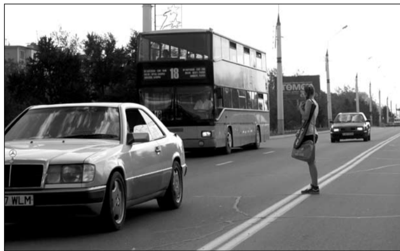
На остановке Второй подъем пешеходы не боятся оживленного движения