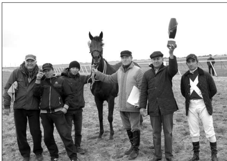
Команда триумфаторов скачек на приз в честь Конституции РК

Стоит отметить, что, в отличие от других скаковых дней, в этот раз не было явного фаворита соревнований. Призы распределялись равномерно между представителями разных конезаводов Казахстана. Так, в скачках на приз «Фаворит» в забеге на 1600 метров очередное первое место для костанайских конезаводчи-