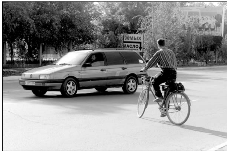
Нарушают правила и велосипедисты