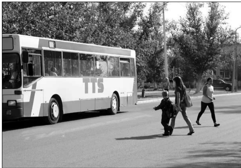
Возле школы № 19 часто родители переходят дорогу с детьми между автомобилями