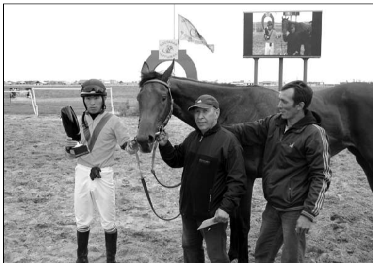
Победитель скачек на приз «Фаворит» костанайская кобыла Лайт Эш

не только наездников, но и тех, кто тренирует и подготавливает к состязаниям племенных скакунов. Для конезаводчиков, жокеев, тренеров и их четвероногих подопечных соревнования начались еще задолго до официального старта.