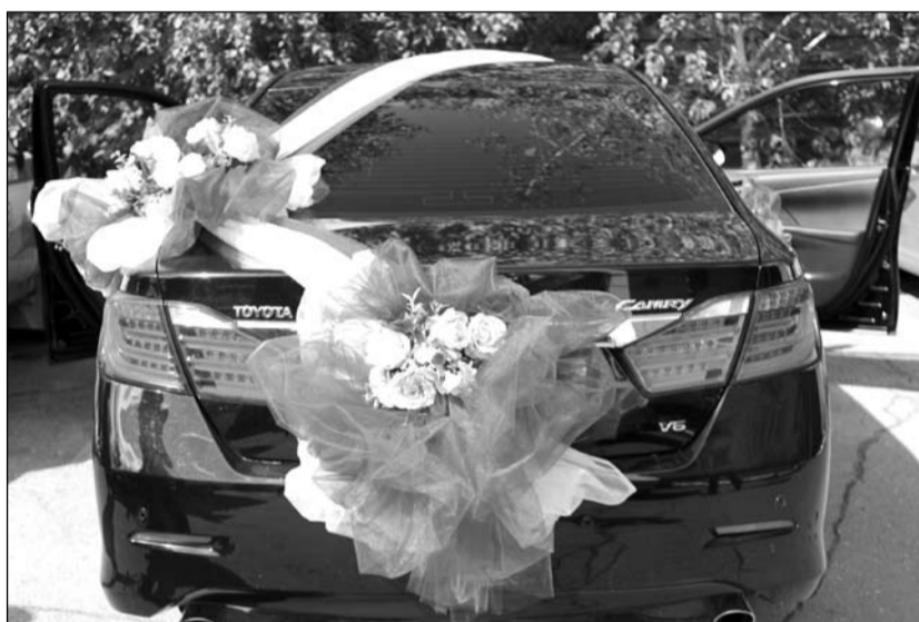
Букет цветов вместо госномера

После долгих споров водитель подчинился требованиям полицейских и поехал на штрафстоянку оформлять протокол. Жениху при-