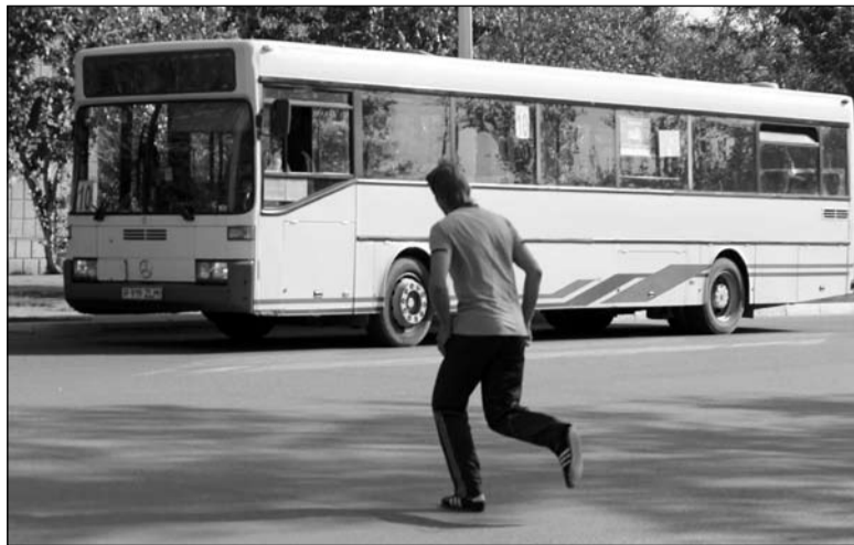
Этот пешеход перебегает дорогу в неположенном месте спеша на автобус