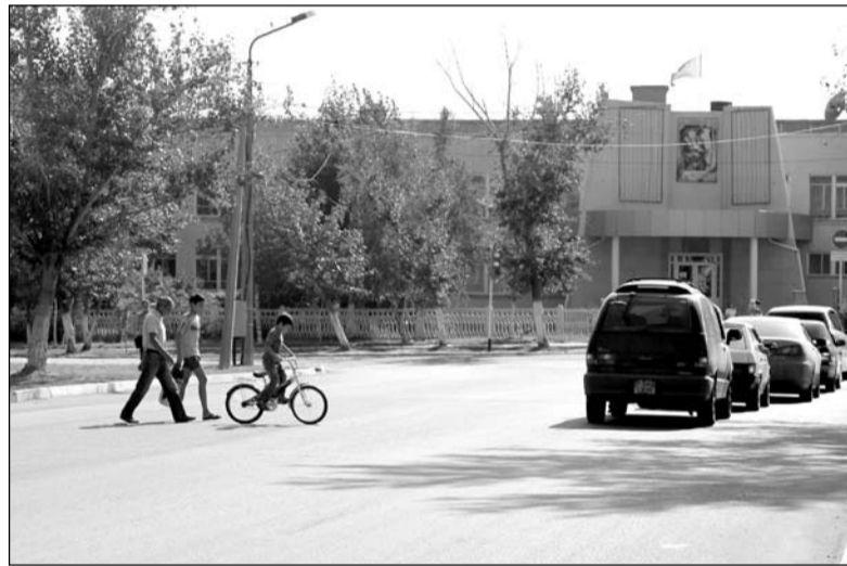
Эта семья переходит дорогу по улице Маяковского в десяти метрах от «зебры»